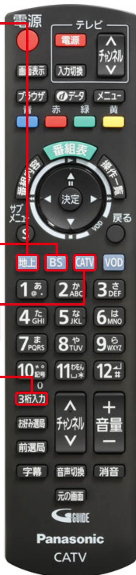
ケーブルテレビチューナー専用リモコン TZ-LP200P/TZ-LS300P/ リサイクル STB

3桁のチャンネル番号が重複する場合、左の画面のように選択画面が表示されますので、▲▼ボタンで視聴したいチャンネルを選択して(選択した項目が黄色になります)決定ボタンを押してください。